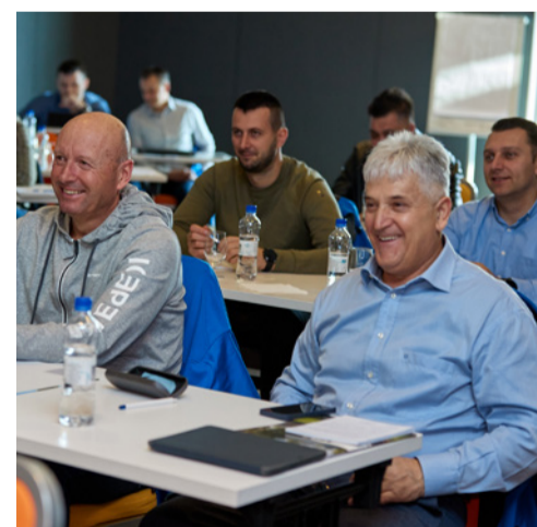
Nova sezona DecAdemy radionice, 2022.

Kao što održivi razvoj i inovacije smatramo neophodnima za budućnost, tako i edukaciju svojih partnera putem DecAdemy projekta vidimo kao kapital koji je ključan za razvoj u vremenima koja slijede. DecAdemy se održava dvaput godišnje, a ove godine će se održati još jednom, u rujnu 2022. godine.