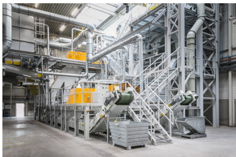
Pogon za recikliranje u Diksmuideu, Belgija

Zalažemo se za čisti okoliš i zbog toga se držimo jasnih načela. S jedne strane identificiramo i smanjujemo izvore zagađenja okoliša, a s druge strane sve što proizvodimo ekološki je održivo.