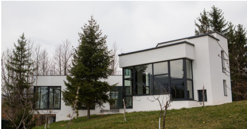
Referenca našeg partnera Sarix d.o.o.

Dugogodišnje uspješne suradnje ne nastaju tijekom noći. Pri odabiru partnera, naglasak uvijek stavljamo na povjerenje i odgovoran odnos jednih prema drugima.