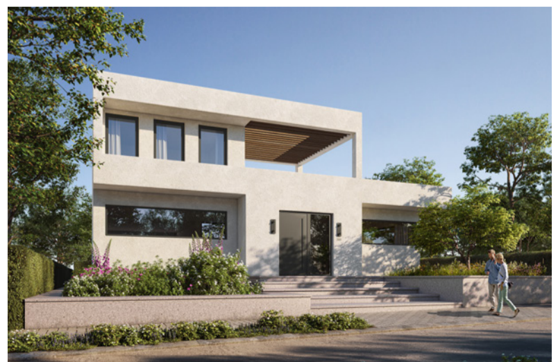
Referenca – profil Elegant

Pozivamo vas da i vi sudjelujete u lokalnim medijskim objavama Deceunincka s dovršenim projektima profila Elegant i HST na koje ste posebno ponosni. Pritom ćete istaknuti svoje poslovanje i što sve dobro iz njega proizlazi. Naime, s ustupanjem vaše reference svaki puta će se navesti tko je proizvođač profila, što doprinosi boljoj vidljivosti ne samo proizvoda, nego i svih ljudi koji stoje iza Deceunincka.