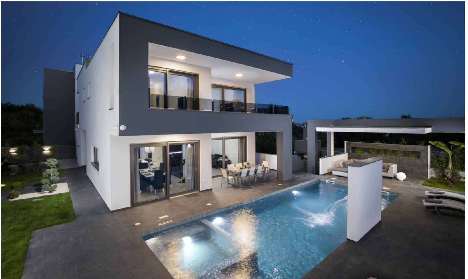
Referenca našeg partnera Select d.o.o.